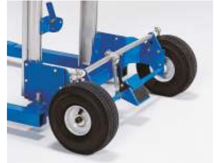
254 mm Luftbereifung mit Fußbremse