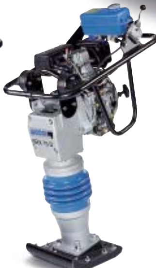
SRX 75 D